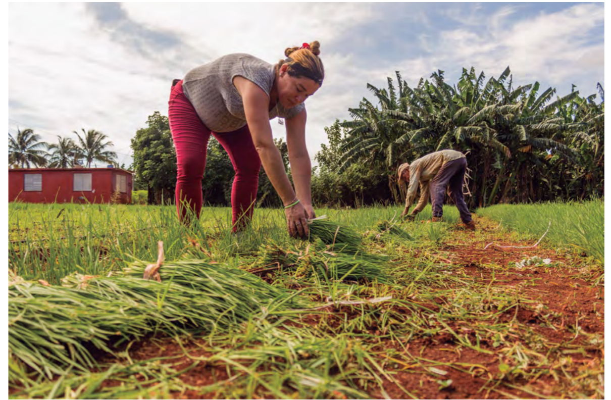
Título: Agricultura urbana en Cuba Autora: Justicia Alimentaria