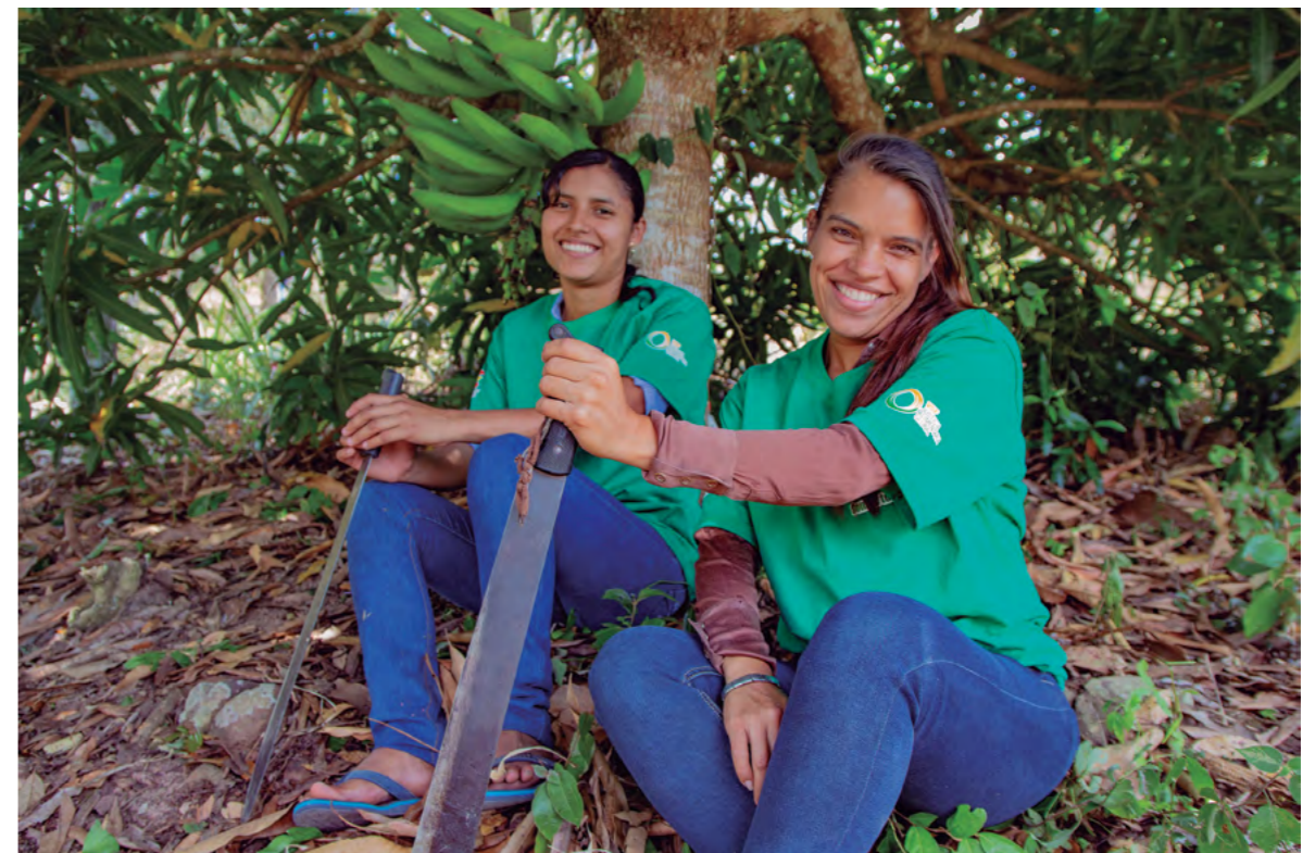
Título: Agroecología en Honduras Autora: Justicia Alimentaria