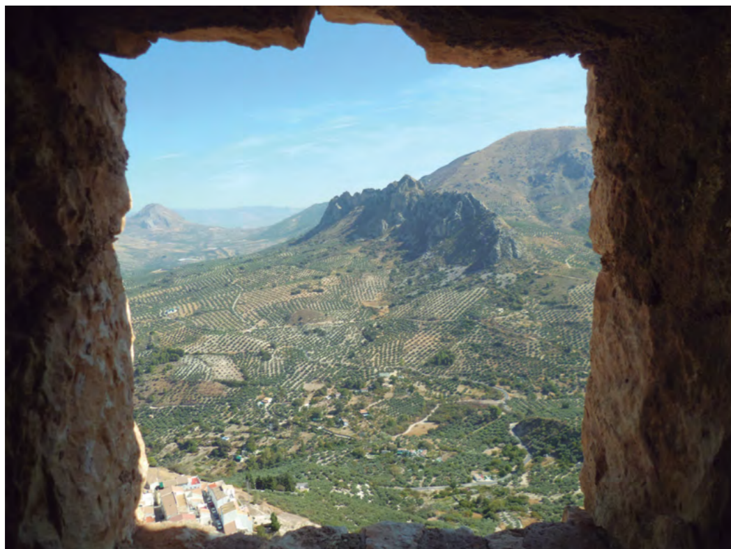
Título: Campos de olivos de Jaén (hasta donde no llega la vista) Autor: Manuel Belmonte