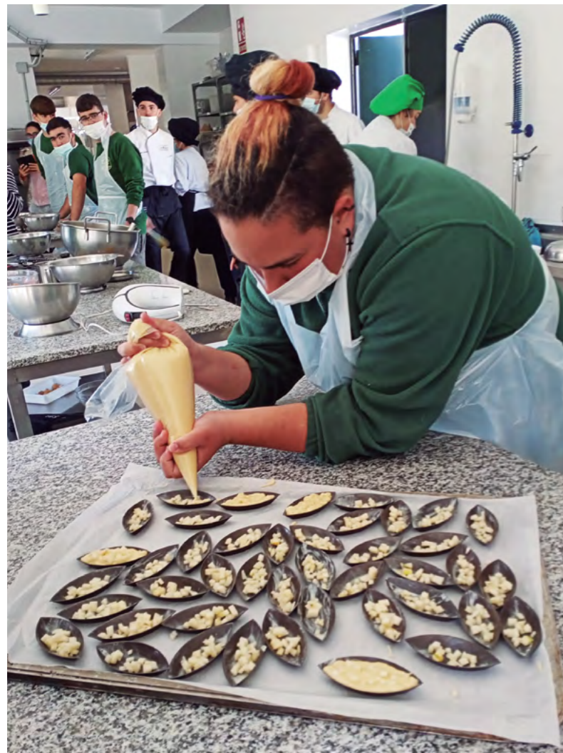
Título: Trabajando en cocina Autora: Justicia Alimentaria