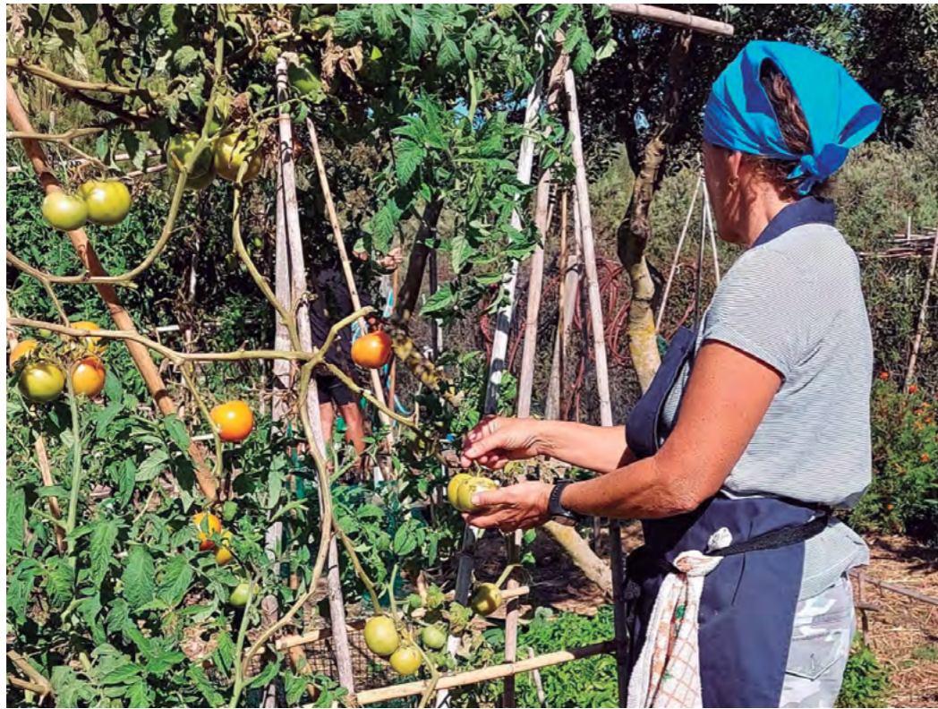
Título: De mi huerta a mi cocina Autora: M a Carmen de la Peña