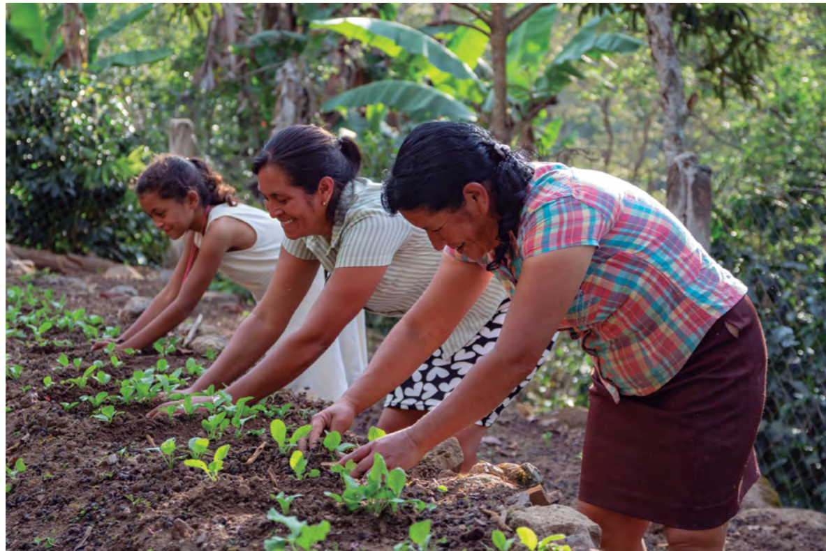
Título: Honduras Autora: Justicia Alimentaria