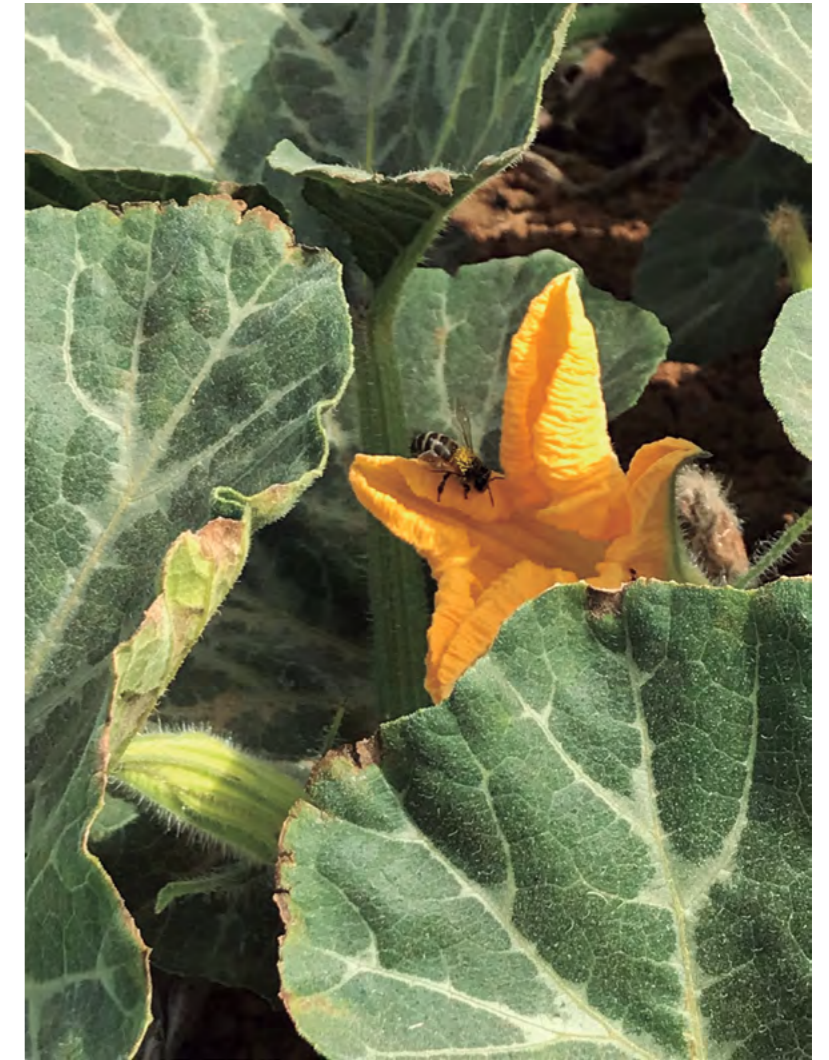
Título: Lo importante es la polinización Autora: M a Paz Estrada

◀ FOTOGRAFÍA GANADORA de la actividad realizada