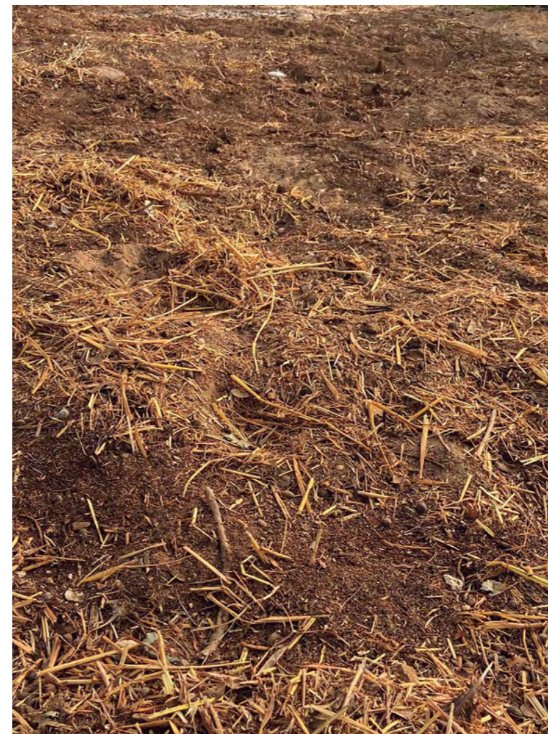
Título: Mucho más que tierra Autora: Rosario Barbero