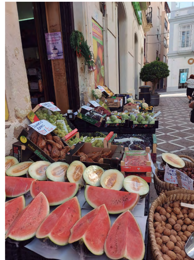
Título: Producto de temporada Autora: Ana Maceiras