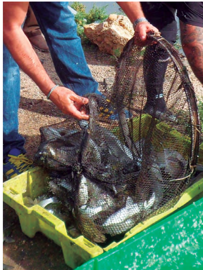
Título: Despesque Autora: M a Carmen de la Peña