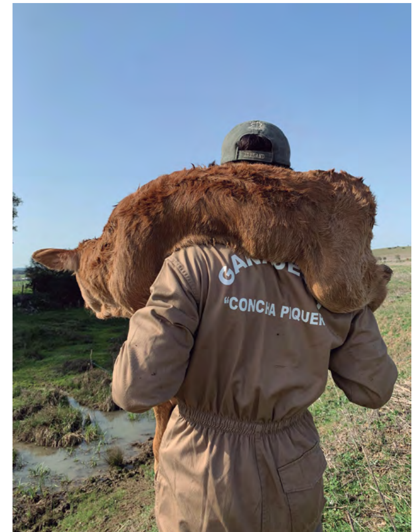
Título: El ternerito Autor: Rubén Cornejo