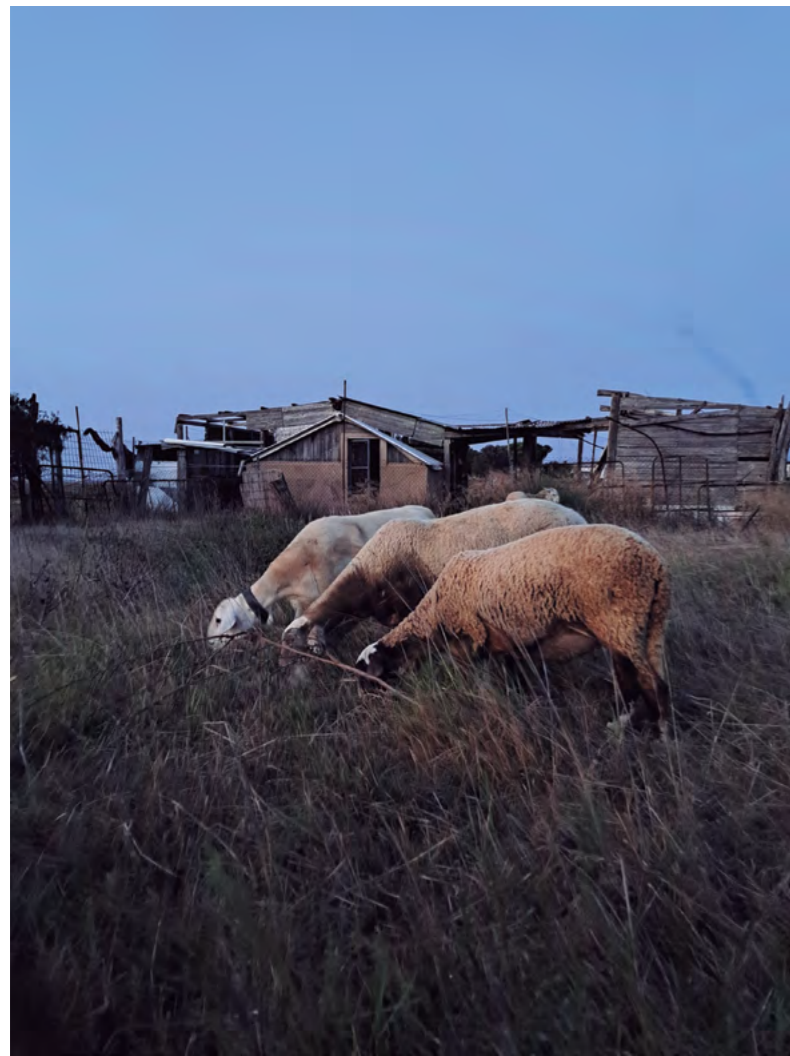
Título: El verdadero herbicida ecológico Autor: Adrián Bohórquez