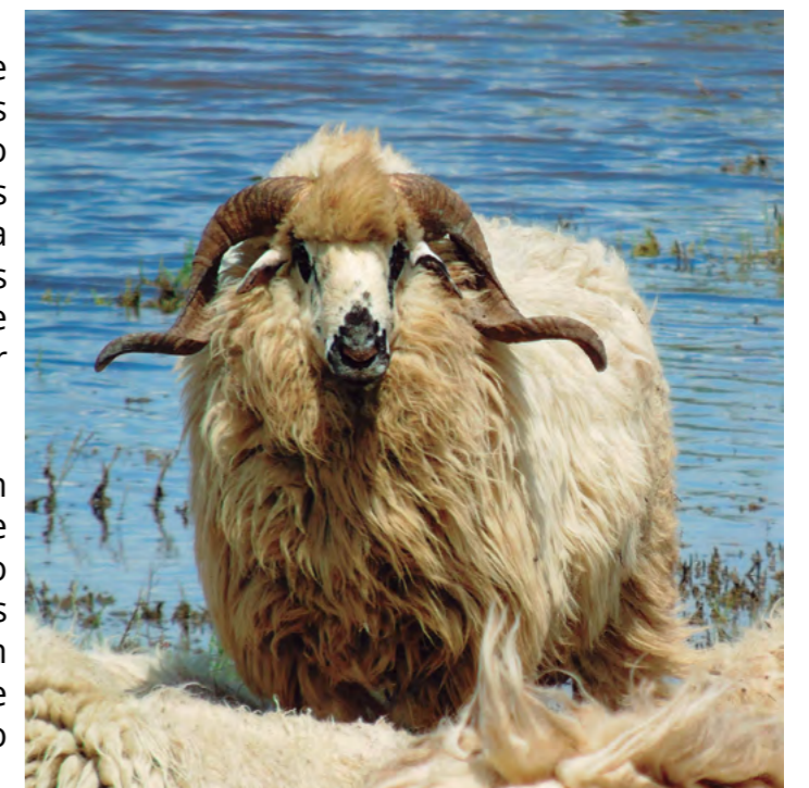
Ejemplar de Raza Churra Lebrijana. Justicia Alimentaria