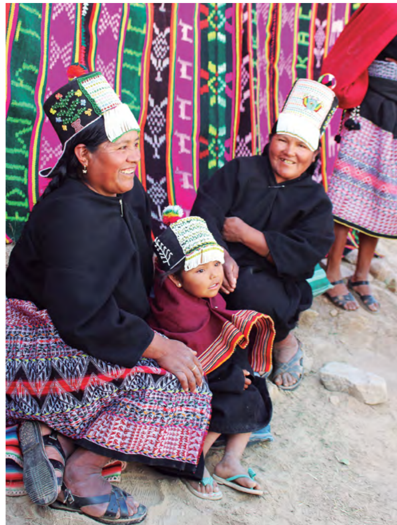
Título: Bolivia Autora: Justicia Alimentaria