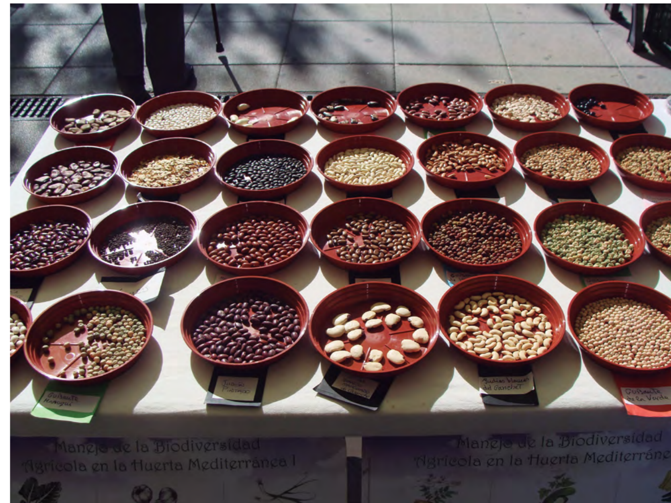
Semillas locales.

Por último, cada grupo comparte los impactos que ha encontrado.