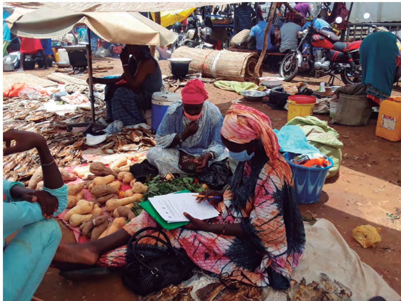
Mercado en Senegal.