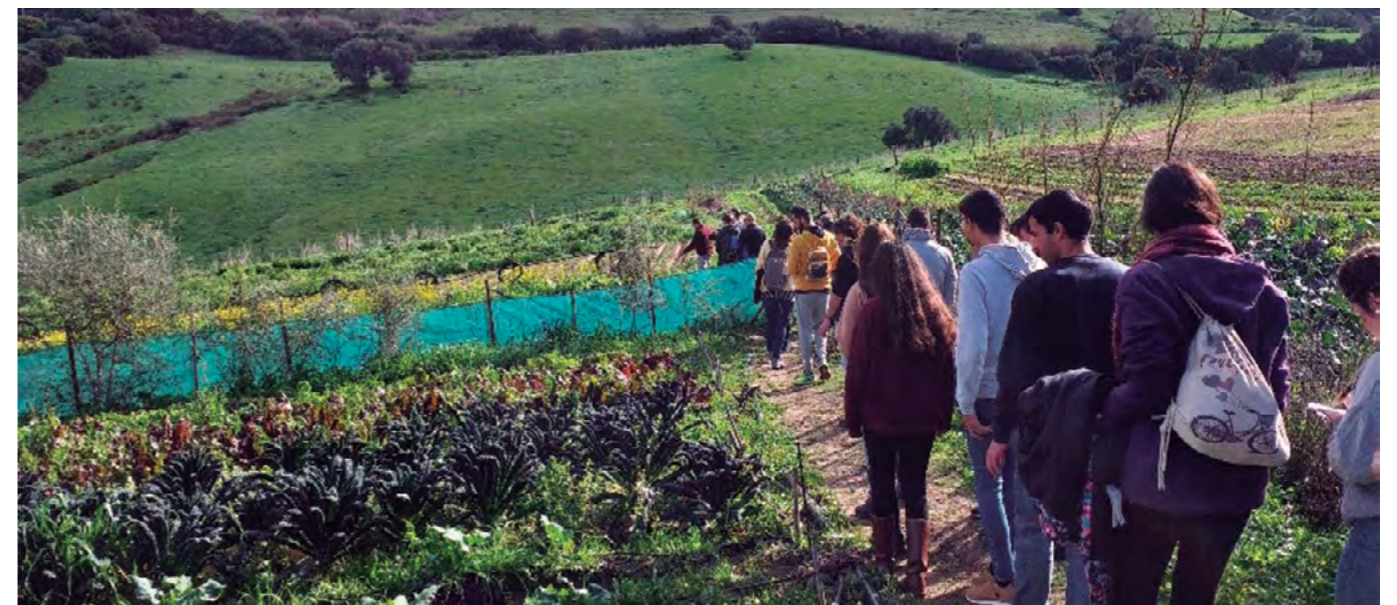
Alumnado visitando huerta ecológica.

Una vez desarrolladas estas actividades se debe conseguir afianzar y socializar los conocimientos del alumnado; crear sinergias entre los diferentes colectivos relacionados con la alimentación, formando redes y ampliando las conexiones entre las distintas etapas del sistema; generar una conexión intergeneracional entre grupos de edad en diferentes momentos vitales y laborales y, por último, ofrecer todo este conocimiento a la ciudadanía en general, aprovechando los recursos puestos a nuestra disposición y ampliando la incidencia del proyecto.