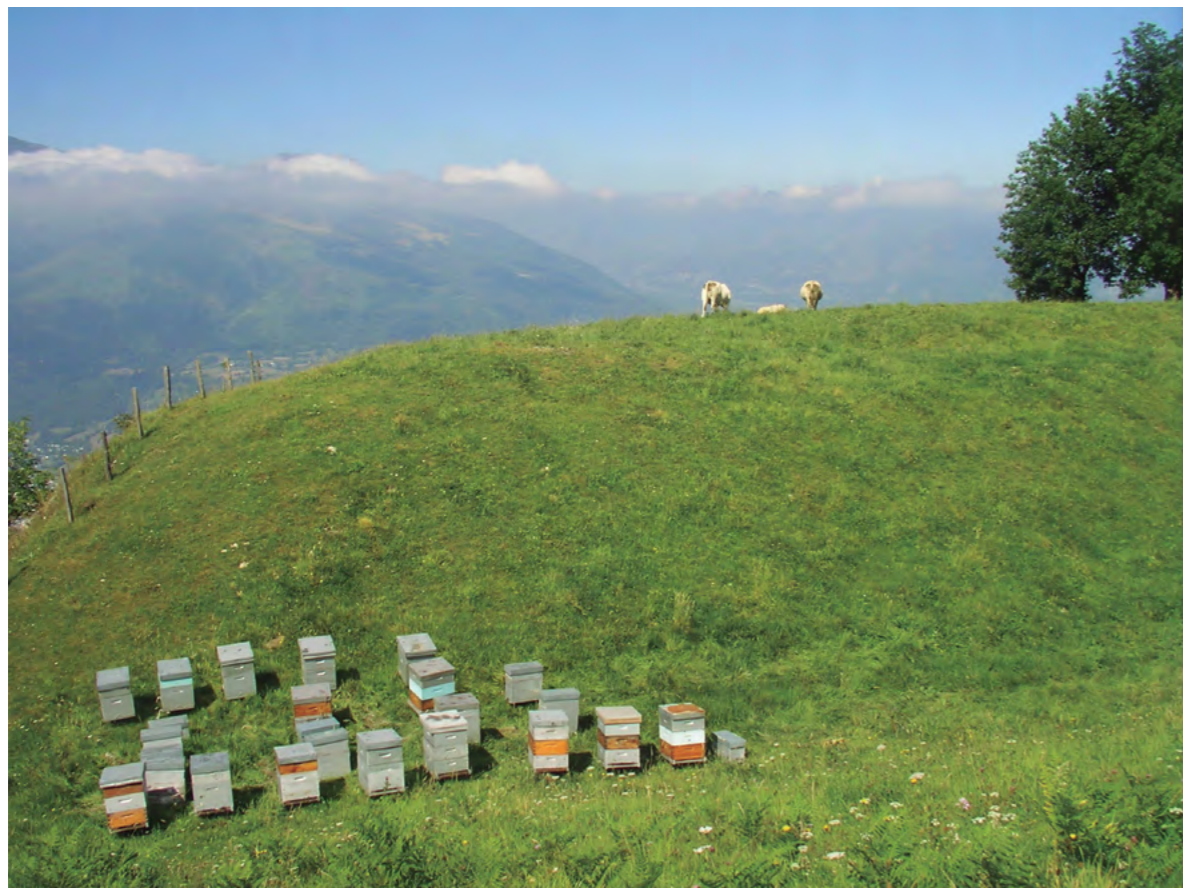
Título: Todo tipo de ganado Autor: Fernando Molero