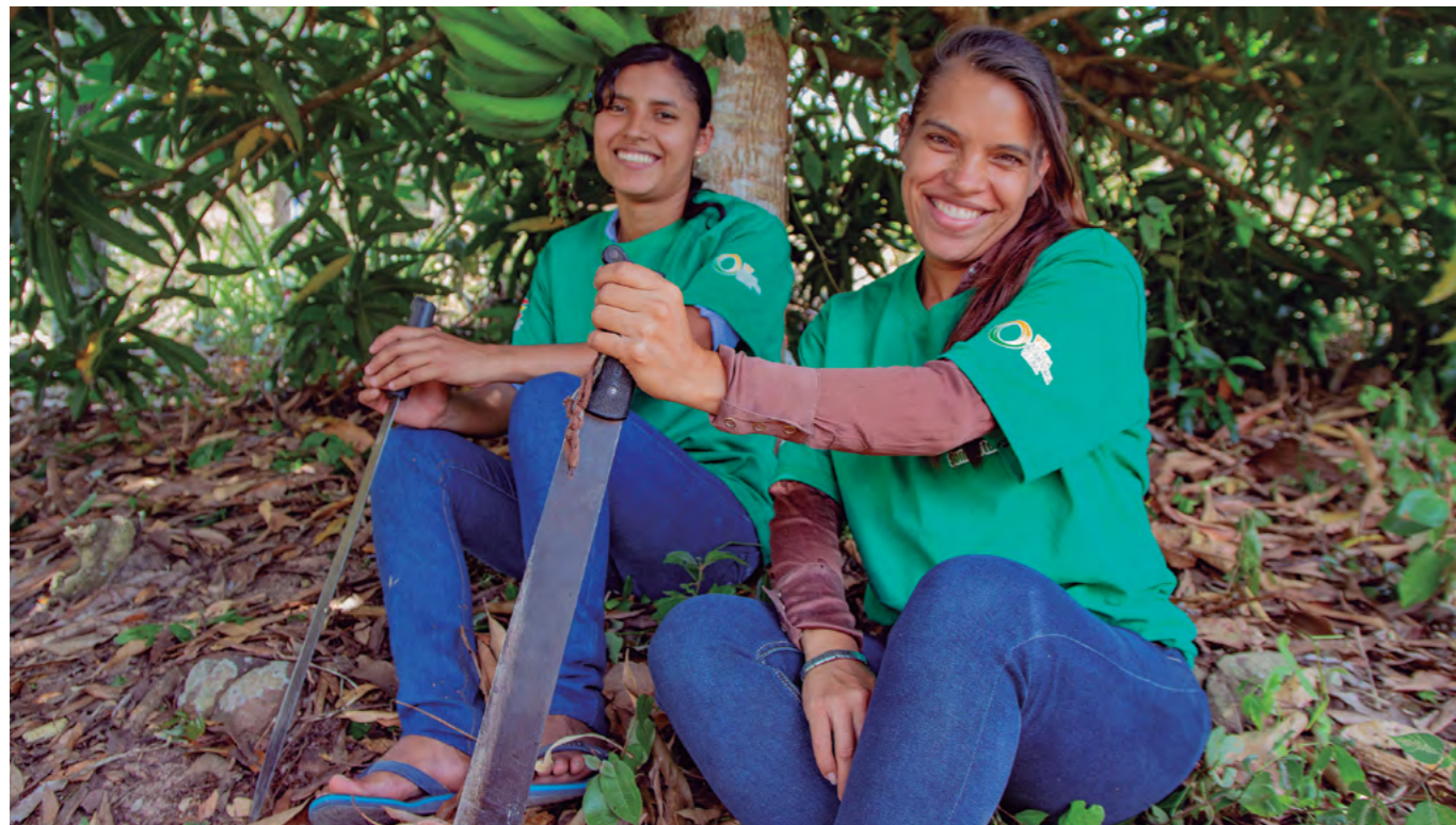
Campeñas hondureñas participantes en acciones de Justicia Alimentaria.

Es por ello que resulta necesario aplicar a las acciones relacionadas con la soberanía alimentaria un enfoque de género, con el objeto de reconocer y visibilizar el papel de las mujeres en la alimentación y los cuidados imprescindibles para la reproducción y la sostenibilidad de la vida. Se trata de una estrategia de cambio social, de construcción de equidad y de puesta en marcha de un sistema diferente de producir y consumir más sostenible, más ecológico, más cercano, más justo y equitativo.