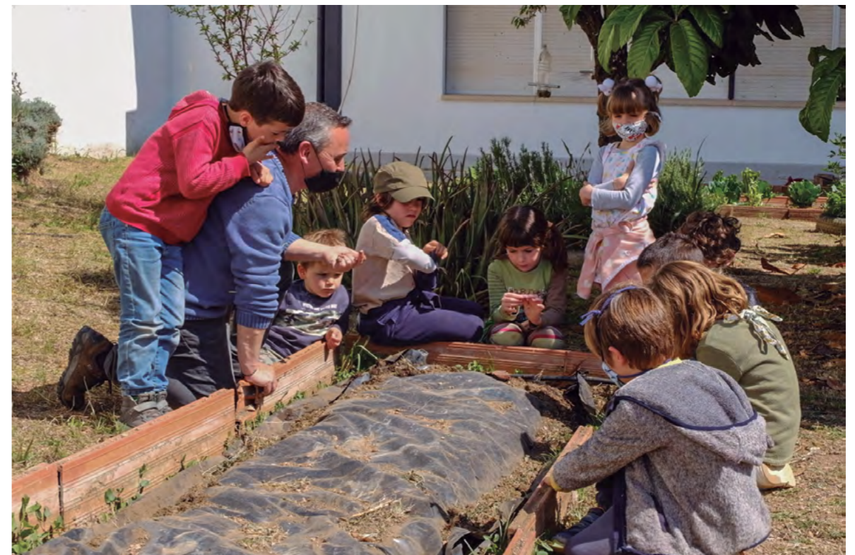
Título: Aprender jugando Autora: Justicia Alimentaria