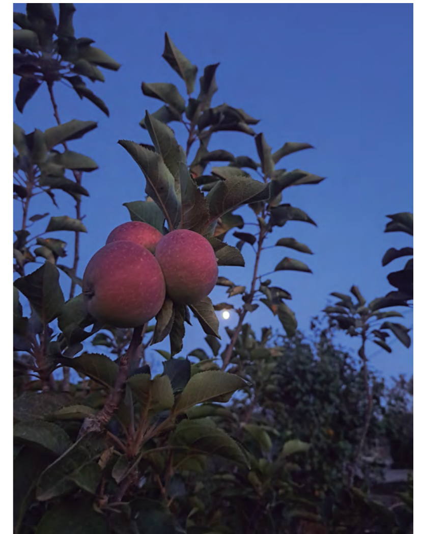
Título: Manzanas libres de insecticidas Autor: Adrián Bohórquez