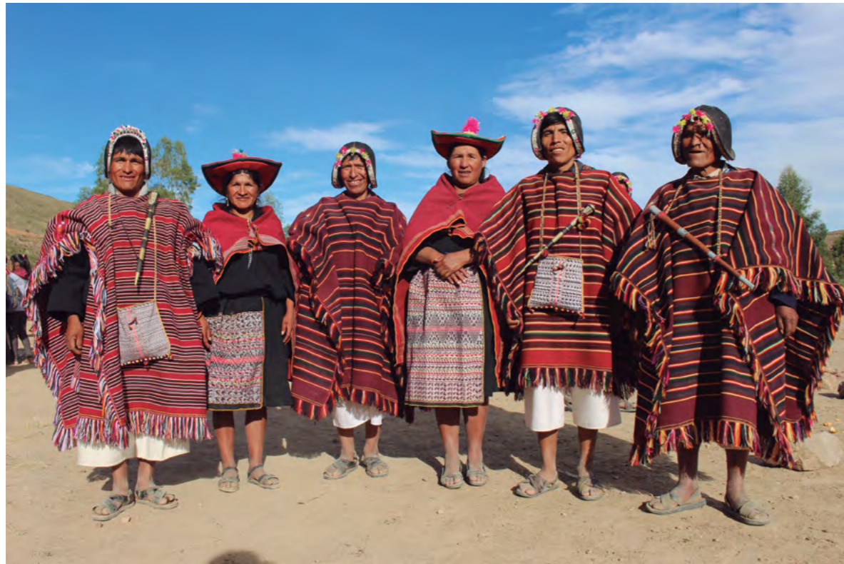
Título: Buenvivir II (Bolivia) Autora: Justicia Alimentaria