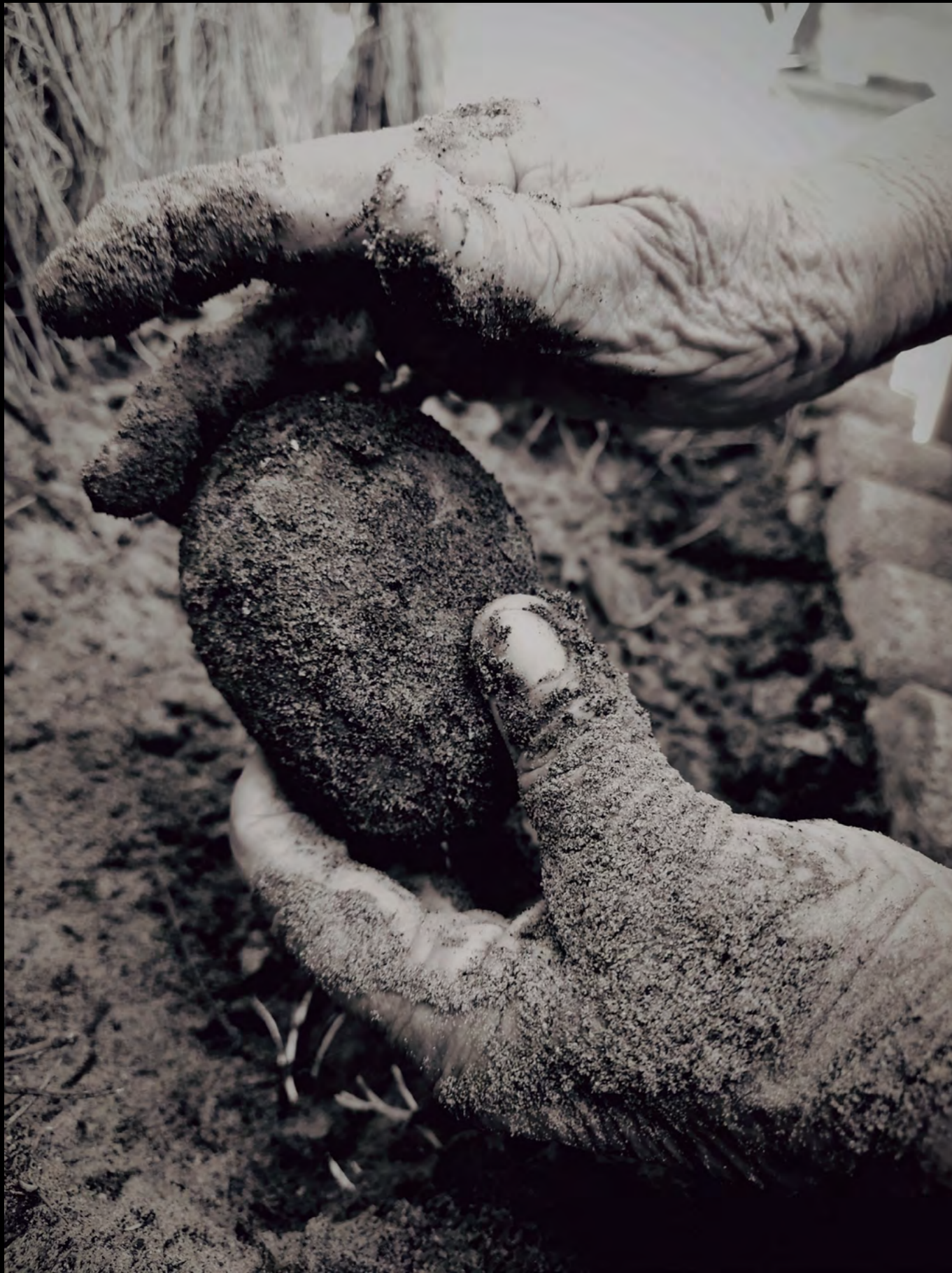
Título: Esfuerzo y dedicación (de sus manos a tu mesa) Autora: Ana Maceiras

Las fotografías seleccionadas para formar parte de la exposición itinerante proceden de fondos propios de Justicia Alimentaria, fotografías aportadas por los centros participantes y, por último, fotografías realizadas por el alumnado. Además, una de ellas ha sido cedida por la Red Andaluza de Semillas.