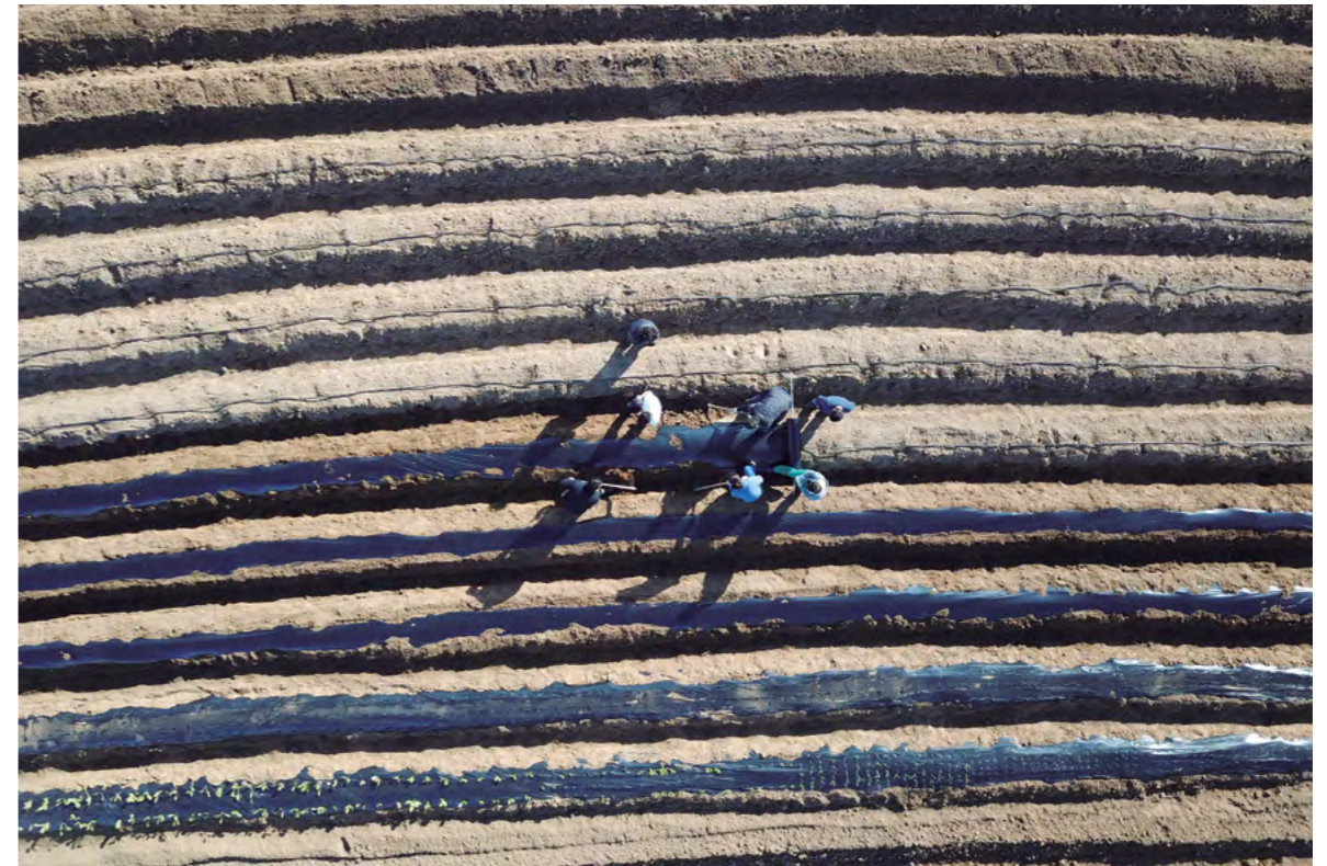
Título: A vista de dron